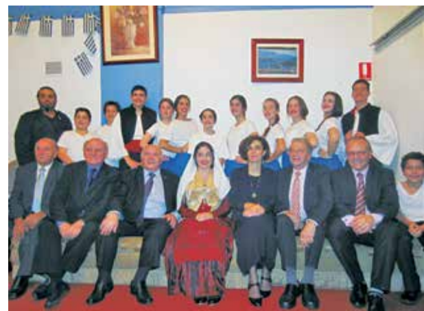
Αποψη από την εκδήλωση παρουσία της Προξένου της Ελλάδος