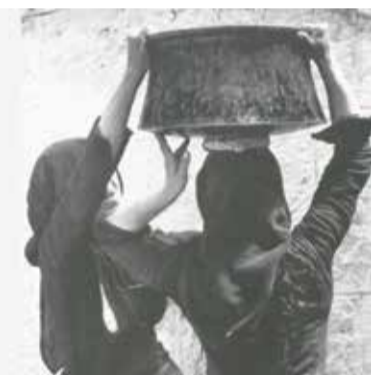
1967 Μανάση, μεταφορά πόσιμου νερού