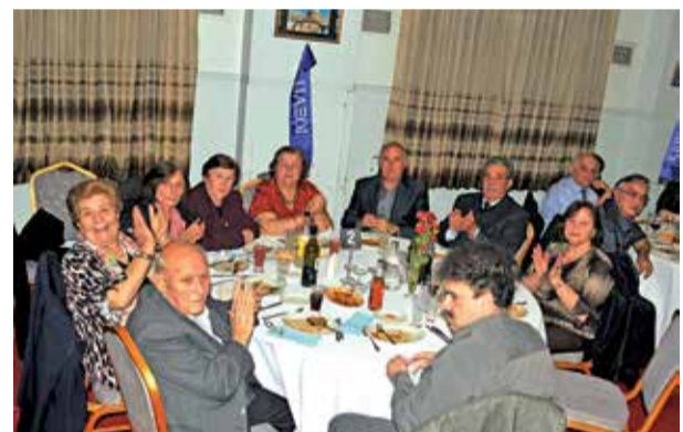
Αγιοπετρίτικη παρέα στο χορό των Επτανησίων στο Λευκαδίτικο Σπίτι