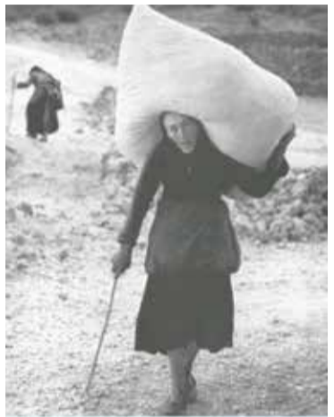
1965 Κομηλιό, γυναίκα μεταφέρει άχυρο