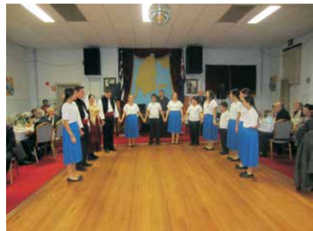
Χορευτικό νέας γενιάς. Επτανησιόπουλα.