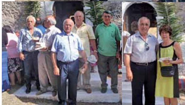
Οι ξενιτεμένοι μας