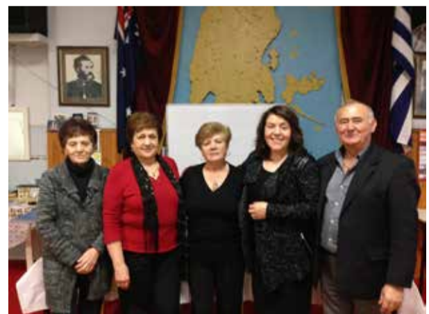
Μια παρέα από Αγιοπετρίτες

Το Δ.Σ. της Ένωσης Αγιοπετρινών Μελβούρνης εκφράζει τα θερμά του συλλυπητήρια στις οικογένειες Αγιοπετρινών που έχασαν πρόσφατα προσφιλή τους πρόσωπα.