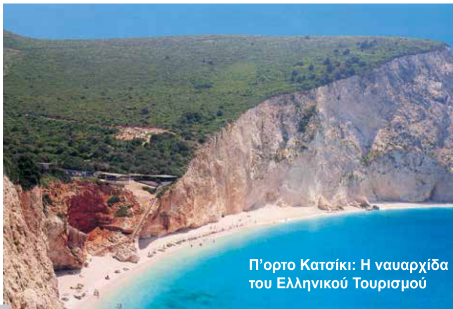
Π'ορτο Κασιόκι: Η ναυαρχίδα του Ελληνικού Τουρισμού